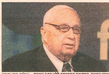
שרון המנוח. החקירה הסתיימה ללא כתב אישום