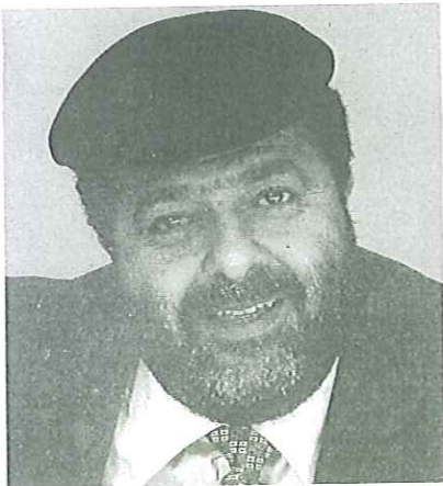
סיף שחנר במיוחד לערבים. נבאון

הצעת חוק העיתונות מעבירה את הסמכות לסגור עיתון מהממשלה לבית המשפט • אבל דווקא שופט העליון לשעבר ונשיאת מועצת העיתונות דליה דורנר לא מרוצה: "החוק החדש מאפשר לשופט לסגור על סוּך חומר חסוי ואין בו את זכות הערעור" • וגם: האם תיק בל"ל הועבר למשמרה מאימת בג"ץ?